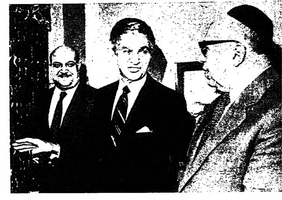
رئيس الدولة في اللقاء اليهودي - العربي في غينوسار :

ور ان المفاوضات التي تخري الأن في واشنطن بين المصرية والإسرائيلية لا يمكنها ان تستقر الى ما هو أكثر ، وبحيث امكان تحقيق استئناف محادثات الحكم الإداري كانت قد توقفت قبل شهرين يطلب من جمهورية مصر العربية . بيروت - تؤكد صحيفة «الشرق» ان المفاوضات التي تجريها إسرائيل مع مصر في شأن الحكم الذاتي في الضفة الغربية وقطاع غزة ، لا يمكن ان تستقر الى ما هو أكثر ، وبحيث امكان تحقيق استئناف محادثات الحكم الإداري كانت قد توقفت قبل شهرين يطلب من جمهورية مصر العربية . ان هذا يعني حقيقة يعترف بها الجميع ، وهي ان مصر قد أرسلت وفديها الى واشنطن كبادرة حسن نية ازاء اتاحة الفرصة للإسرائيليين كي يتبينوا انهم جادون في إجراء مفاوضات جادة ، وأنهم ليسوا بالمتحدين ، وأنهم ليسوا بالمتحدين ، وأنهم ليسوا بالمتحدين . في حين ان المفاوضات التي تجريها إسرائيل مع مصر في شأن الحكم الذاتي في الضفة الغربية وقطاع غزة ، لا يمكن ان تستقر الى ما هو أكثر ، وبحيث امكان تحقيق استئناف محادثات الحكم الإداري كانت قد توقفت قبل شهرين يطلب من جمهورية مصر العربية .